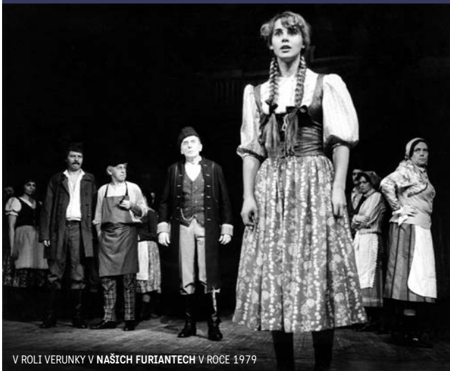
V ROLI VERUNKY V NAŠICH FURIANTECH V ROCE 1979

Musím říct, že mě to pořádně zasáhlo. Bylo to, jako když ti někdo vezme půlku těla. Takový pocit jsem nikdy nezažila.