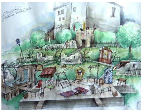
NÁVRH SCÉNY TŘÍ VETERÁNŮ NA KUNĚTICKÉ HOŘE OD IVO ŽÍDKA.