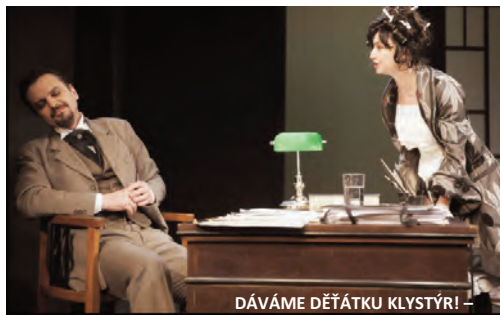
DÁVAME DĚTÁTKU KLYSTÝR! –