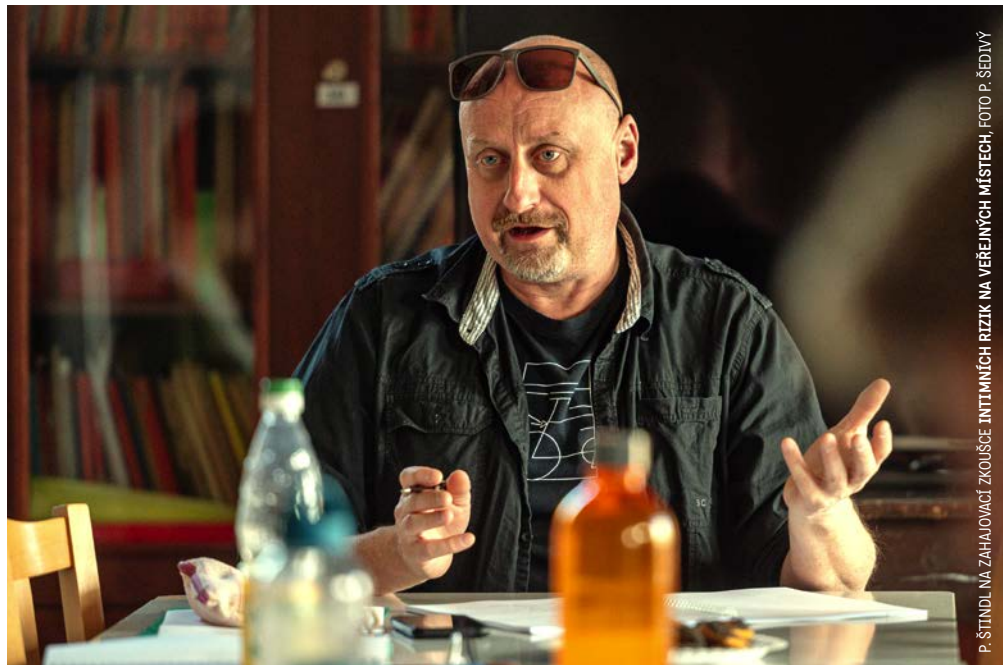
P. ŠTINDL NA ZAHAJOVACÍ ZKOUŠCE INTIMNÍCH RIZIK NA VEŘEJNÝCH MÍSTECH

Režisér PETR ŠTINDL inscenoval v Pardubicích na podzim 2019 Společenstvo vlastníků, které před tím uvedl jen soubor Vosto5, pro nějž autor Jiří Havelka tuto hru napsal. Po pardubické premiéře ji uvedlo dalších šest divadel. Tentokrát u nás Petr chystá inscenaci hry Alana Ayckbournu INTIMNÍ RIZIKA NA VEŘEJNÝCH MÍSTECH, která se na české scéně objeví úplně poprvé. Uvidíme, jestli nás někdo bude následovat.