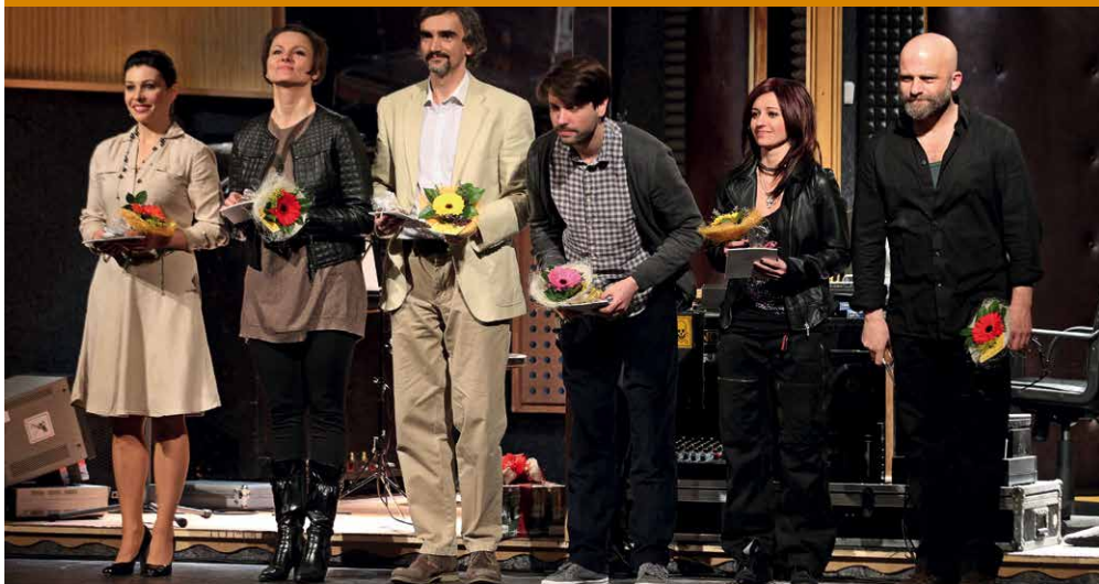
HERCI VÍTĚZNÉ KOMEDIE DABING STREET PŘI DĚKOVAČCE PO FESTIVALOVÉM PŘEDSTAVĚNÍ

Petr Zelenka / DABING STREET Režie Petr Zelenka Dejvické divadlo, Praha