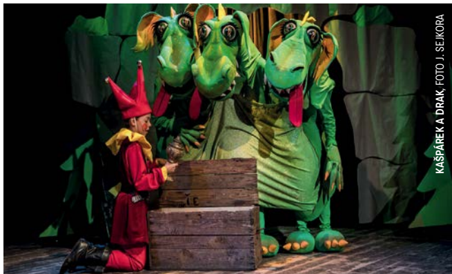
KÁSPÁREK A DRÁK

V listopadu čekají Mladé divadelní studio LAIK, které působí při Východočeském divadle již šestou sezónu, hned dvě derniéry. Jako první se budou loučit mladší členové studia s pohádkou KÁSPÁREK A DRÁK , kterou uvádějí v komorním prostoru Malé scény ve dvoře. Druhé loučení prožije starší část souboru na velkém jevišti Městského divadla, kde naposledy odehraje hiphopovou komedii VÝLET .