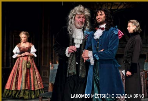
LAKOMEC MĚSTSKÉHO DIVADLA BRNO

UPOZORŇUJEME NA ZAHÁJENÍ PRODEJE FESTIVALOVÝCH VSTUPENEK. Už v pondělí 5. listopadu obchodní oddělení odstartuje prodej cenově zvýhodněných permanentek na soutěžní program. Ve středu 14. listopadu pak budou uvolněny do prodeje vstupenky na jednotlivé tituly.