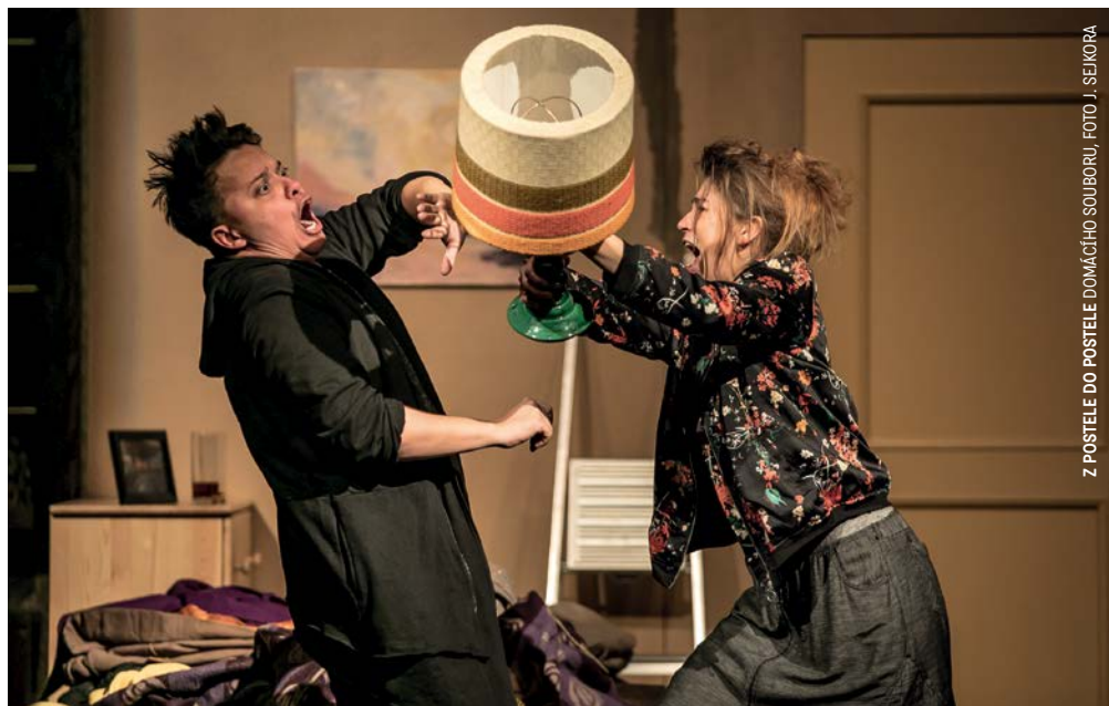
Z POSTELE DO POSTELE DOMÁČHO SOUBORU