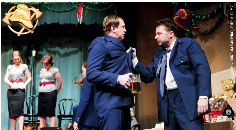
S M. MENCEM V HOŘE, MÁ PANENKOI