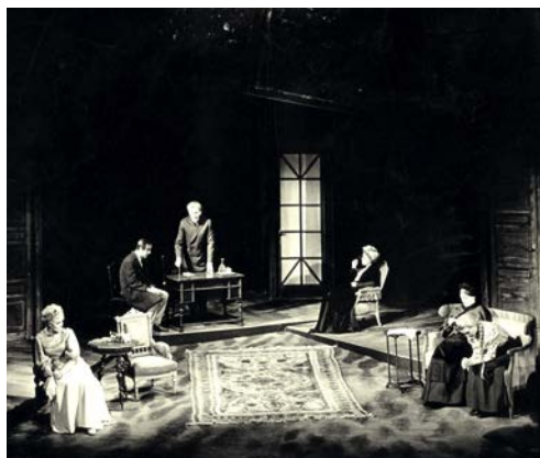
SCÉNOGRAFIE VÝTVARNÍKA JIŘÍHO FIALY