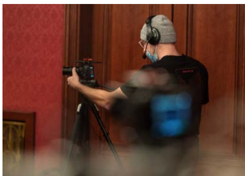
PEČLIVÁ PŘÍPRAVA KAMERY.