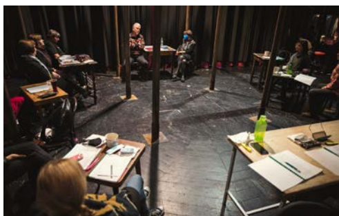
JEVIŠTĚ MĚSTSKÉHO DIVADLA S KULISAMI ŽITKOVSKÝCH BOHYNÍ PŘI PRVNÍ ČTENÉ ZKOUŠCE.