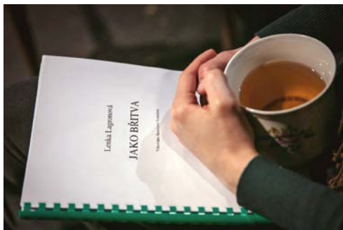
TEXT HRY V RUKOU HLAVNÍ PŘEDSTAVITELKY.

2. února se v Městském divadle uskutečnila „zahajovačka“ inscenace hry Lenky Lagronové JAKO BŘITVA , kterou s naším souborem právě připravuje režisér Radovan Lipus (ROZHOVOR S NĚM NALEZNETE NA NÁSLEDUJÍCÍ DVOUSTRANĚ). Obraz Boženy Němcové na pozadí všudypřítomné průměrnosti by měl mít premiéru 20. března, ale... RaS