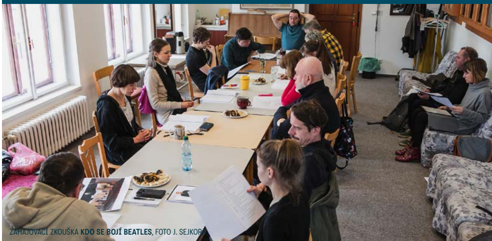
ZAHAJOVACÍ ZKOUŠKA KDO SE BOJÍ BEATLES