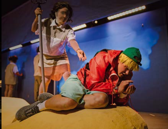
† J. LÁSKA, PODIVNÝ PŘÍPAD SE PSEM