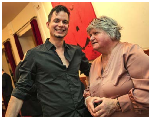
TAKÉ HONZU MUSILA PŘIJELA NA SOBOTNÍ PREMIÉRU PODPOŘIT JEHO MAMINKA.