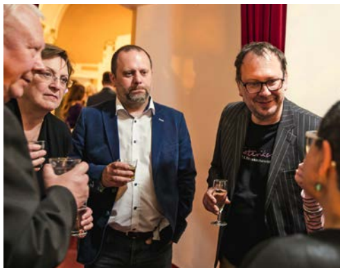
REŽISÉR FILIP NUCKOLLS (VPRAVO) BYL PO PREMIÉŘE V OBLEŽENÍ ZNÁMÝCH A KAMARÁDŮ A PŘIJÍMAL ŘADU GRATULACÍ.