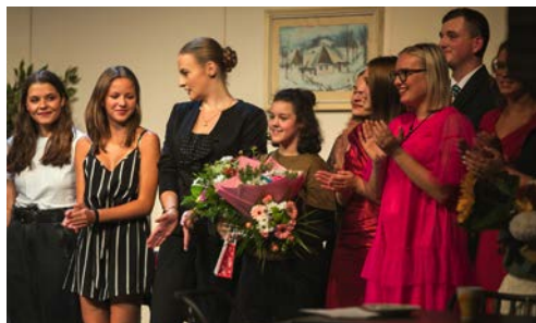
ČLENOVÉ STUDIA LAIK SI OD PREMIÉROVÉHO PUBLIKA VYSLOUŽILI BOUŘLIVÉ DLOUHOTRAVJÍCÍ OVACE!