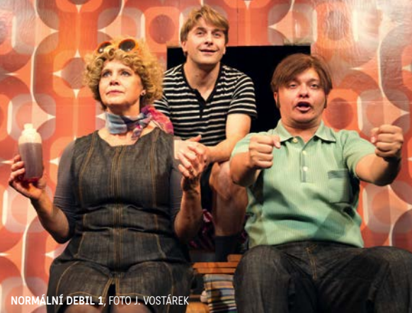
NORMÁLNÍ DEBIL 1