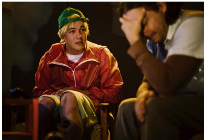
↑ V ROLI CHRISTOPHERA S. L. ŠPÍNEREM V PODIVNÉM PŘÍPADU SE SEM

Co od budoucnosti čekáš? Větší klid, nebo naopak více práce?